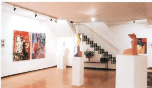
Exposició col·lectiva d'artistes sabadellens, antics alumnes de Sant Nicolau.