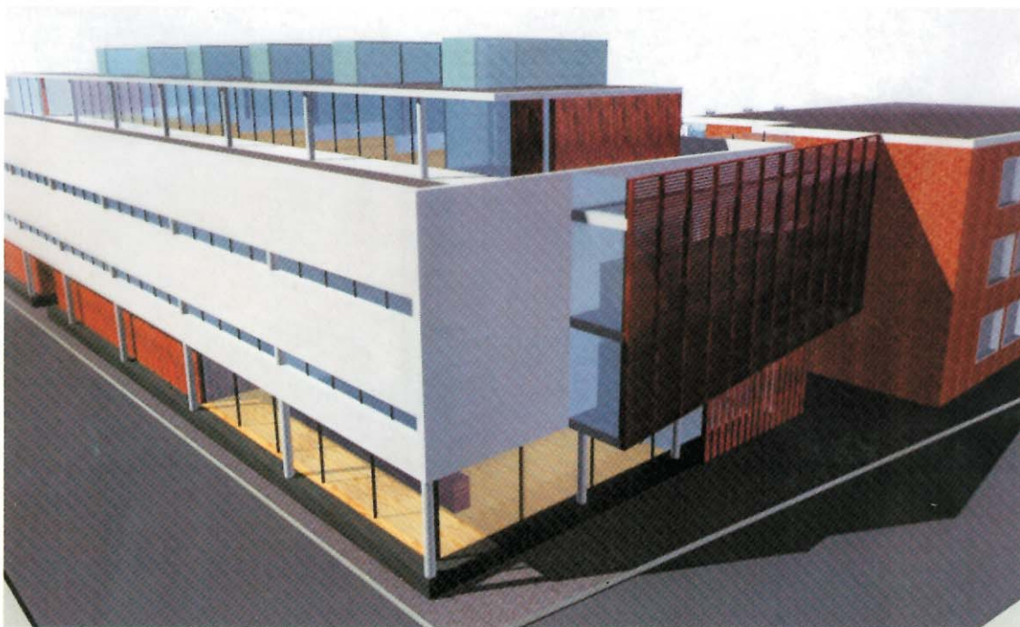
Façana principal Jardí/Turull

rosier llambés Roba de casa, bates i davantals