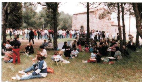
Festa a l'Ermita de Sant Nicolau

Las Hormiguitas. Escola construïda amb la col·laboració de la campanya "l'escola fa escola"