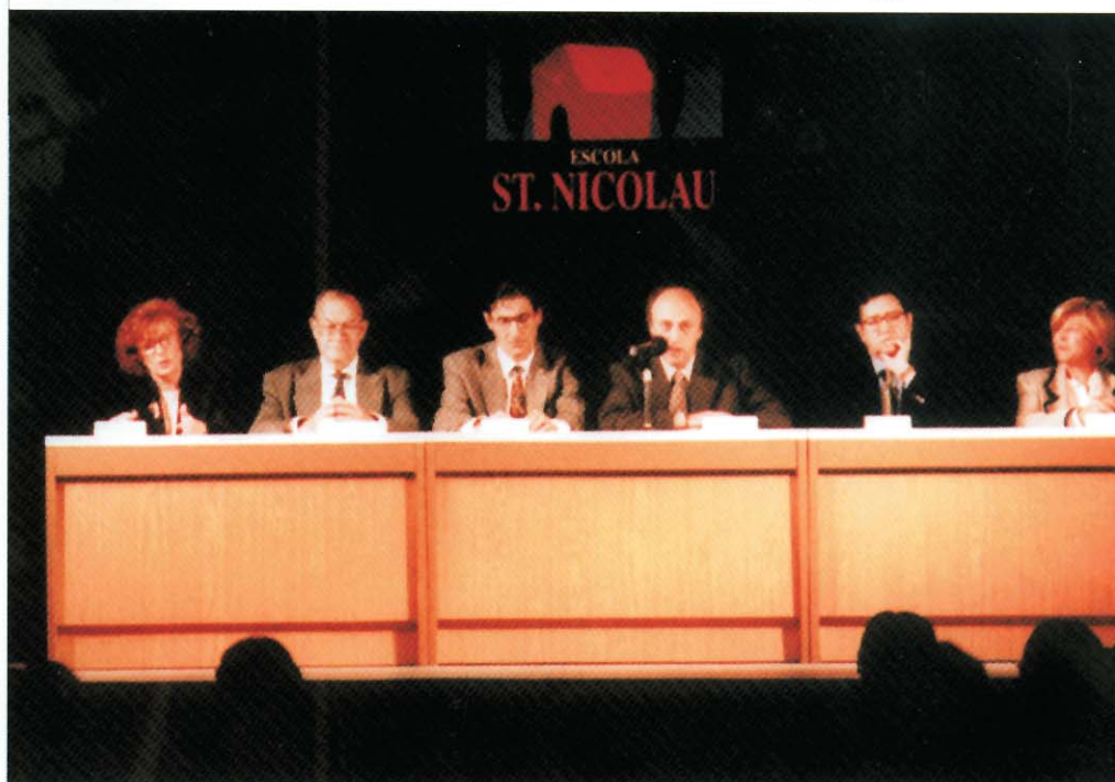
Acte d'inauguració del 40è aniversari de l'escola