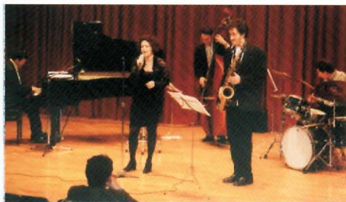
Concert de Jazz