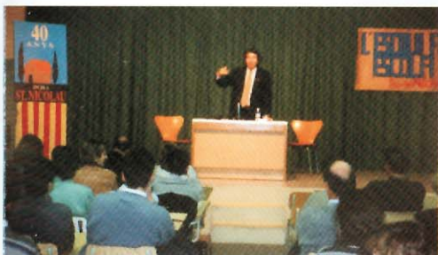
Cicle de conferències