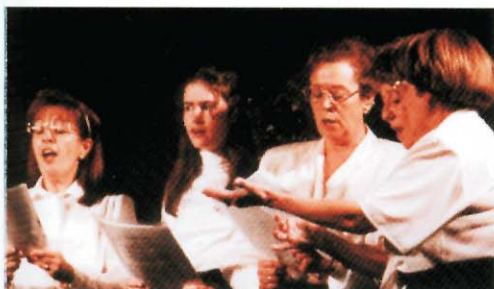
Concert inaugural del 40è aniversari.